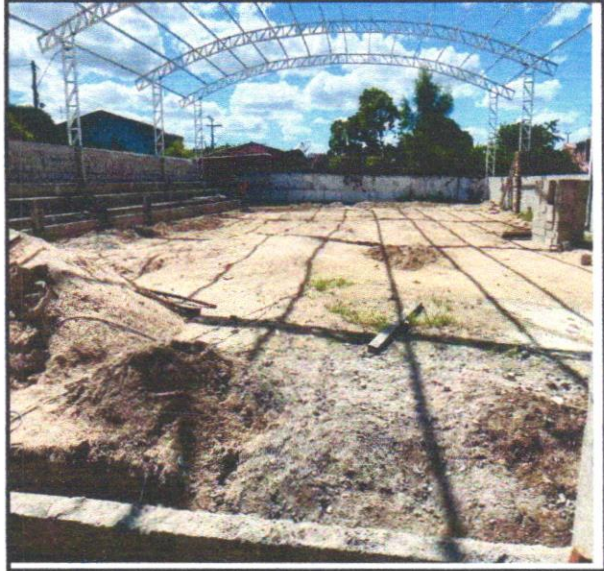
FOTO - 07 :LASTRO COM MATERIAL GRANULAR (PEDRA BRITADA N.1 E PEDRABRITADA N.2),

FOTO - 06 :CAMADA SEPARADORA PARA EXECUÇÃO DE RADIER, PISO DE CONCRETO OU LAJE SOBRE SOLO, EM LONA PLÁSTICA. AF_09/2021